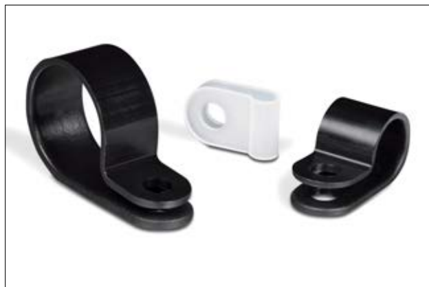
P-klips HP1P - HP18P i forskellige dimensioner.